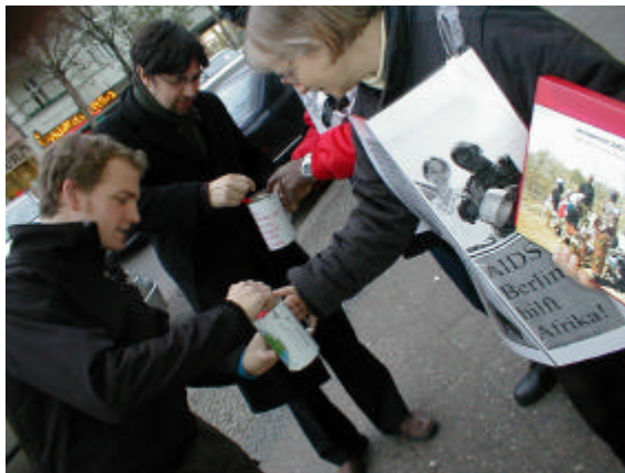
Jeder Beitrag zählt!

Ausbildung von Grundschullehrern, Arbeit gegen HIV/AIDS, Vorschulen, Berufsschulen, Förderung von Kleingewerbe, Kinderdörfer, Schulen für benachteiligte Kinder, Kinderhilfe/Dorfentwicklung.